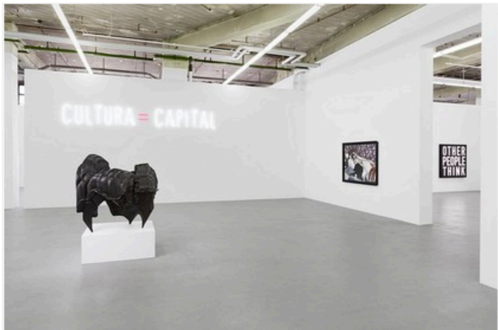
Tony Cragg, Helmut Newton, Afredo Jaar